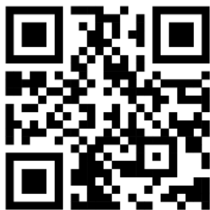
QR-Code digitale Aktenauflage

Zudem können die Unterlagen digital abgerufen werden mithilfe des folgenden QR-Codes: